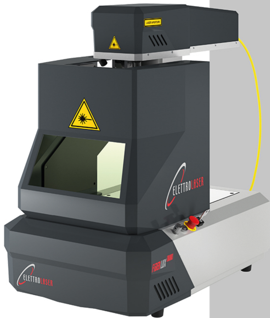
Z-axis manual adjustment Regolazione manuale asse Z