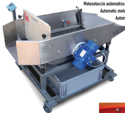
Motosetaccio automatico. Automatic motorised sieve. Automatisches Motorsieb. Moteur tamis automatique.