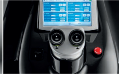
User-friendly HMI Interfaccia utente semplice