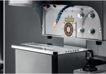
XYZ motorized table Tavola motorizzata a tre assi