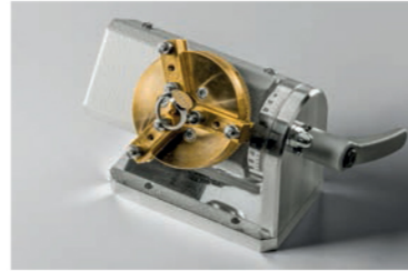
Rotor axis Rotore per saldature circolari